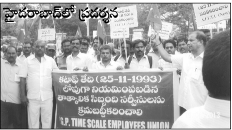
హైదరాబాద్, 19-7-13 :

రాష్ట్రవ్యాప్తంగా వివిధ శాఖలలో ఎన్.ఎమ్.ఆర్ / దినసరివేతన / కన్సోలిడేటెడ్ పే / టైం స్కేలు తదితర తాత్కాలిక విధానాలపై 25.11.93 (కటాఫ్ తేదీ)కి పూర్వం నియమించబడిన, కటాఫ్ తేదీనాటికి 5 సం॥ల సర్వీసు పూర్తిగాని సిబ్బంది సర్వీసుల క్రమబద్ధీకరణ కొరకై ఉద్యోగులు గత చాలాకాలంగా ఆందోళన సాగిస్తున్నారు.