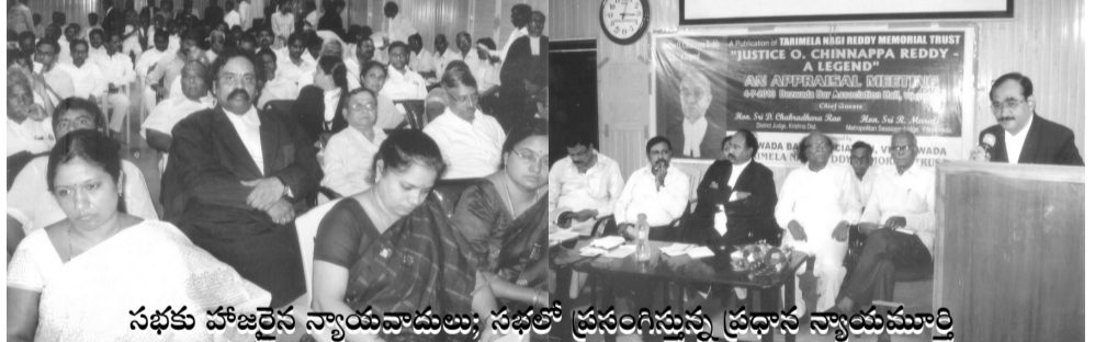
సభకు హాజరైన న్యాయవాదులు; సభలో ప్రసంగిస్తున్న ప్రధాన న్యాయమూర్తి