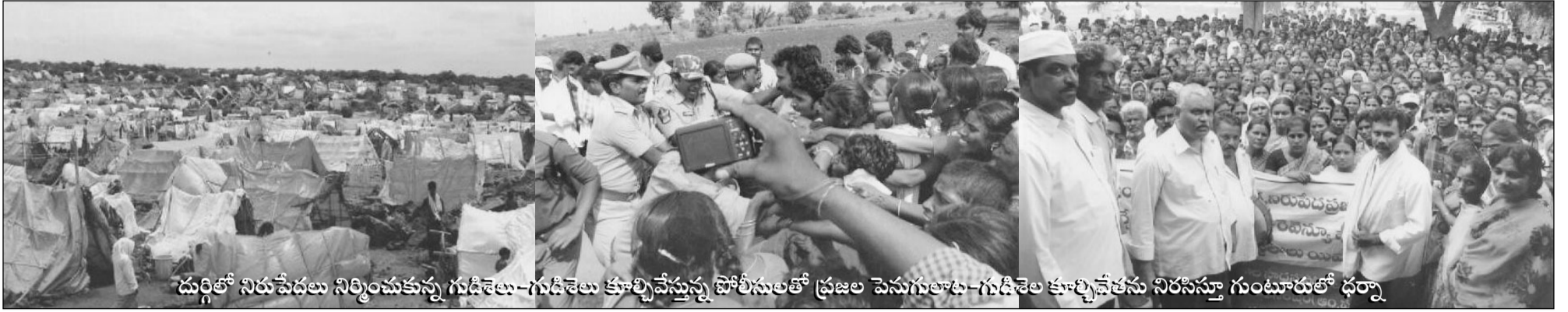
దుర్గిలో నిరుపేదల నిర్మించుకున్న గుడిశెల-గుడిశెల కూల్చివేస్తున్న పోలీసులతో ప్రజల పెనుగులాట-గుడిశెల కూల్చివేతను నిరసిస్తూ గుంటూరులో ధర్నా

గుంటూరుజిల్లా - మండల కేంద్రమైన దుర్గి గ్రామంలో, తలదాచుకోను గూడులేని నిరుపేద లందరూ గత నాలుగు సంవత్సరాలుగా తమకు ఇండ్లస్థలాలు కేటాయించాలని కోరుతూ జిల్లాలోని వివిధ స్థాయిల్లోని ప్రభుత్వ అధికారులకు విజ్ఞప్తులు చేస్తూవచ్చారు. సెంటు స్థలం లక్షరూపాయలు వలుకుతున్న ఈ రోజుల్లో కూలిదబ్బులు కూటి గింజలకే సరిపోని, రెక్కల కష్టంపై ఆధారపడ్డ ఆ నిరుపేదలకు స్థలం కొనుగోలు చేసి స్వంతంగా ఇళ్ళు కట్టుకునే స్థోమతలేదు. అనేక సం॥లుగా అద్దె గదులలో వుంటూ అద్దెబకాయిలు చెల్లించలేక, పిల్లలు పెరిగి పెద్దవారై, పెండ్లిడ్లయి, చిన్న చిన్న గదులలో రెండు, మూడు కుటుంబాలు కాపురముంటూ నానా అవస్థలు పడుతున్నారు.