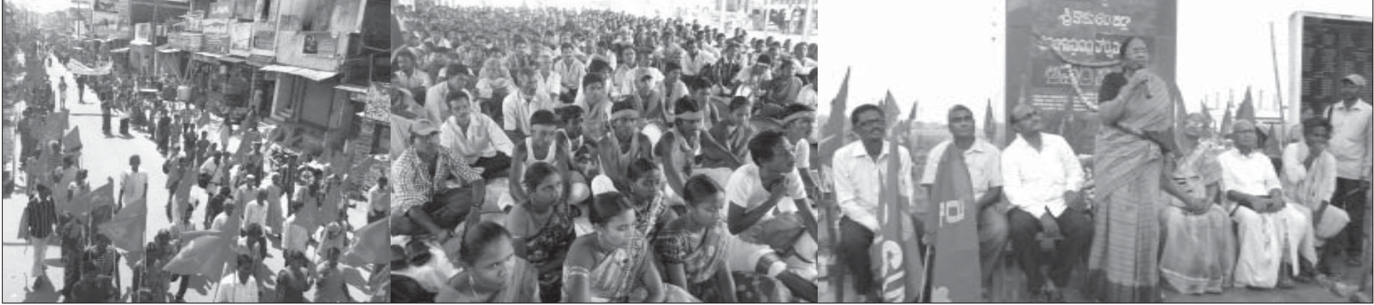
పార్వతీపురంలో ప్రదర్శన; వర్ధంతిసభకు హాజరైన గిరిజన ప్రజానీకం; శ్రీకాకుళంలో అమరుల స్థూపం వద్ద సభలో ప్రసంగిస్తున్న కా॥ రూఝి; (దిగువున) శ్రీకాకుళంలో అమరుల స్థూపం వద్ద నివాళులు