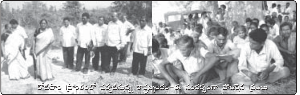
కోటిపాం ప్రాంతంలో పర్యటిస్తున్న రాష్ట్రబృందం-ఈ సందర్భంగా హాజరైన ప్రజలు