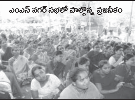
ఎంఎన్ నగర్ సభలో పాల్గొన్న ప్రజనీకం