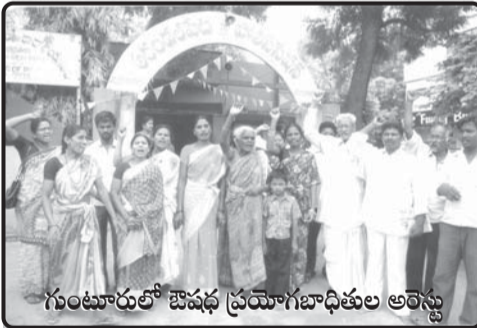
గుంటూరులో ఔషధ ప్రయోగ బాధితుల అరెస్టు