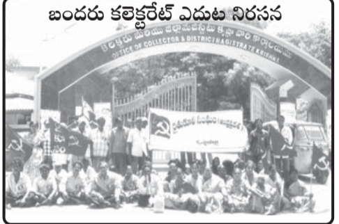
బందరు కలెక్టరేట్ ఎదుట నిరసన