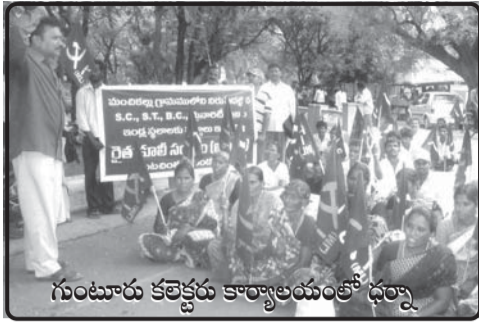
గుంటూరు కలెక్టరు కార్యాలయంలో ధర్నా