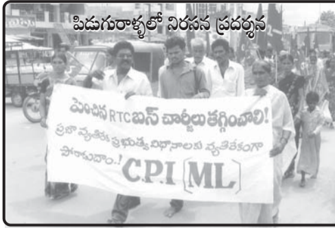
పిడుగురాళ్ళలో నిరసన ప్రదర్శన